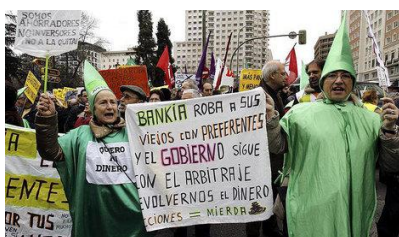
Besitzer von entwerteten Partizipationsscheinen protestieren in Madrid

tet werden. Vorher wurde groß die Werbetrommel gerührt und neben staatlichen Fonds und den beiden spanischen Großbanken Santander und BBVA auch viele Kleinanleger dazu gebracht, in diese Bankia-Aktien zu investieren. Nicht einmal ein halber Jahr später fiel der Preis dieser Aktien ins Bodenlose, da Bankia ja nur die Zahlungsunfähigkeit der 7 fusionierten Sparkassen bei sich vereinigte. Die Bank mußte verstaatlicht werden und wird seither mit staatlichen Garantien künstlich beatmet. Die Kleinanleger schauten durch die Finger.