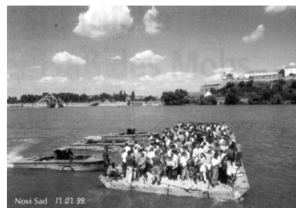
Am Balkan durchgesetzt: westliche Wertegemeinschaft

Ob und wann imperiale Mächte stellvertretend für ihre Währungen dann doch aufeinander einschlagen oder Rußland in Schranken verweisen zu müssen meinen, in denen es sich ohnehin befindet, läßt sich schlechterdings nicht voraussagen: Und das gerade, weil klassisch imperialistische Argumentationen nur noch zur oberflächlichen Rationalisierung des Vorgehens gegen jeweils ausgespähnte Feinde des Freihandels und der Demokratie vorgebracht werden — wenigstens von seiten der Amerikaner; der reine Idealismus Deutschlands weist „Interesse“, gar merkantiles, von sich. Nicht der klassische Imperialismus tarnt sich ethisch, sondern der imperialistische Firnis über der reinen Ethik ist dünn geworden.