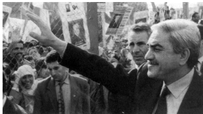
Präsident General Liamine Zéroual

machen will. General Khaled Nezzar wurde offiziell in den Ruhestand versetzt, faktisch aber von der Macht verdrängt. Zwei Lager liegen miteinander im Streit und teilen sich vermutlich die Macht. Die Organisation und Effizienz des Militärs leidet entsprechend darunter. Es gibt keinen Verteidigungsminister (mehr), das Amt bekleidet in Person alunion der gegenwärtige Präsident der Republik, General Liamine Zéroual, der mit dem Etikett eines „Versöhnlers“ behaftet ist. Generalstabschef Maussade Lamari dagegen gilt als der „éradicateur“, der Vernichter, weil er gegen jegliche Verhandlung mit den Islamisten eintreten und deren totale Eliminierung vertreten soll. Ihm untersteht allerdings nicht die Staatspolizei, eine Eliteeinheit der besttrainierten und bestausgerüsteten Soldaten. An deren Spitze wurde erst im Sommer General Tayeb Derradji berufen, ein enger Verbündeter Zérouals. Er löste General Maussade Touati ab, einen Alliierten Lamaris, was in Militärkreisen gar nicht gern gesehen wurde. Denn Derradji gilt als „Politikopf“, und das heißt in diesem Fall als Befürworter von Verhandlungen mit den Islamisten.