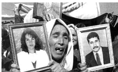
Demonstrantinnen mit Fotos ermordeter Angehöriger

Dennoch: Sieht man einmal von den heute schier unangreifbaren Firmengeländen ab, gibt es keine schlüssige Erklärung dafür, warum die Relaisstationen der durch unwegsame Wüstenzonen führenden Gaspipeline nicht zum Angriffsobjekt islamischer Gruppen werden und es bisher nur einen einzigen Anschlag, vor drei Jahren, gegen eine Pumpstation in der Nähe von Batna gegeben hat.