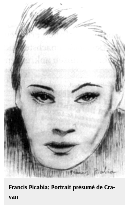
Francis Picabia: Portrait présumé de Cravan

Kenntnisse einem Künstler schaden könnten, aber Esel bleibt Esel und Temperament besitzen, heißt, sich selbst nachzuahmen. Ich sehe also bei Delaunay einen Mangel an Temperament. Wenn man das Glück hat, ein Rohling zu sein, muß man es bleiben können.“