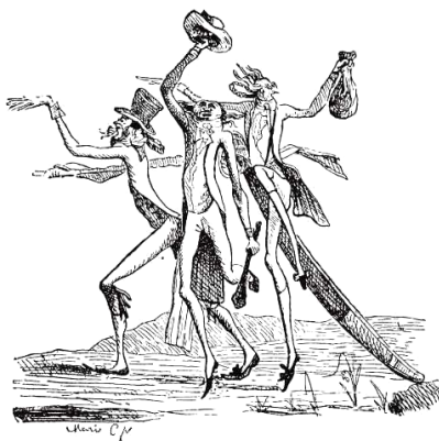
Anonym: Französische Modekarikatur um 1800

Stunde nun anbrach, hieß Palloy, später im Volksmund Palloy-Bastille . Er erhielt den Auftrag, das Staatsgefängnis abtragen zu lassen. Er tat weit mehr: er entfesselte eine patriotische Orgie. Palloy verwandelte die Festung in ein Arsenal pseudokünstlerischer revolutionärer Geschenk- und Andenkenartikel. Aus den Steinen ließ er Hunderte von Büsten Rousseaus und Mirabeaus anfertigen und an den Konvent, an Offiziere, Provinzbürgermeister und durchreisende Andenkenjäger verteilen; aus Ketten und Gitterstäben wurden Medaillen mit der Erklärung der Menschenrechte gegossen. Daß Palloy nebenbei mit hetzerischen, meist ordinären Bildsatiren schwunghaften Handel trieb, veranschaulicht nicht nur seine patriotische Vielseitigkeit, sondern einen merkwürdigen Wesenszug seiner Epoche. Und eben darum ist seine Gestalt von entwicklungsgeschichtlichem Rang. Er verkörpert nicht nur den Prototyp des betriebsamen Kunstmanagers, der in unseren Tagen hinter die Maske des Kulturstrategen geschlüpft ist, sondern auch den Schnittpunkt zweier künstlerischer Ausdruckssphären, die man bis dahin getrennt wahrzunehmen gewohnt war: mit seinen Karikaturen wendet sich Palloy keineswegs bloß an das „niedrige Volk“, sondern an alle Menschen, denen er seine Büsten und Medaillen zusendet; sein Publikum wollte erhabene Allegorik, es wollte aber auch den derben Stimulans der Bildsatire.