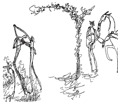
Paul Klee: Zeichnung zu Voltaires „Candide“ (1913)

Karikatur bedeutet Verstoß gegen eine Wertordnung, die sich gesichert glaubt. Wo sie am rücksichtslosesten zupackt, in der politisch-gesellschaftskritischen Bildsatire, entspringt sie dem umfassenden Erlebnis einer in Unordnung geratenen Welt und steht in ihren Ursprüngen bewußt außerhalb der künstlerischen Konventionen. Ihre ersten Dokumente sind Nachricht, Kundmachung, „Zeitung“ schlechthin. Sie entstammen einem Bereich, in dem das aggressive Pathos der Karikatur wohl noch nicht zum künstlerischen Pathos gediehen ist, dafür aber seine Herkunft aus magischen Erlebnisphären unverhüllt zu erkennen gibt. Geistesgeschichtlich reicht die Karikatur auf einen mittelalterlichen Brauch zurück, der den politischen Gegner oder den gerichtlich Verfolgten lächerlich machen und herabsetzen wollte. Karikatur ist Angriff: sie entstellt den Menschen, sie greift ihn nicht nur in übertragenem Sinne an, sie deformiert ihn. Das Vorbild dieses Aktes, der in unseren Tagen auf die ästhetische Sphäre beschränkt ist, bilden die Schand- und Spottbilder des späten Mittelalters. Der Verurteilte, der sich dem Spruch zu entziehen mußte, wurde in effigie gerichtet, das Urteil wurde an einem primitiven Bildwerk, an einer Strohuppe etwa, vor den Augen der Öffentlichkeit vollzogen, die an der symbolischen Bloßstellung eines Menschen ihr Schauspiel hatte.