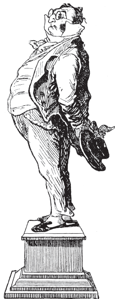
Monnier: Denkmal des Prud'homme (um 1840)

es einfallen, der Musik- und Literaturproduktion das Recht auf eine Unterhaltungsbranche zu bestreiten, noch wird man dem Publikum sein begründetes Bedürfnis nach Divertissement ausreden wollen. Daß dieses Bedürfnis aber auch von Bildern gesättigt werden will, würde den Wächtern vor dem Kunsttempel nie eingehen, und die Existenz einer Unterhaltungsmalerei käme in ihren Augen einer Entwürdigung gleich. In diesem Punkt hat sich nichts verändert, und die Schrittmacher der gegenstandslosen Kunst verfechten heute einen Monopolanspruch, welcher dem der klassizistischen Theoretiker früherer Jahrhunderte nichts an Ausschließlichkeit nachgibt.